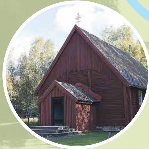
3. Turkansaaren kirkko Turkansaarentie 165, 90310 Oulu

Turkansaaren kirkko sijaitsee Turkansaaren ulkomuseon alueella. Oulujoki oli keskiajalla karjalaisten kauppiaiden tärkeä kulkureitti Pohjanlahdelle. Turkankylästä ja Turkansaaressa kehittyi markkinapaikka, jonka myötä saaresta tuli epävirallinen rajapiste Venäjän ja Ruotsin välille. Sana turkka, turku, merkitsee kauppapaikkaa.