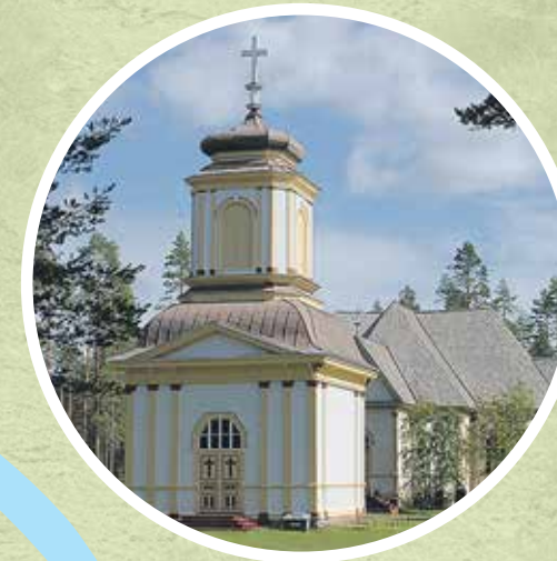
7. Säräisniemen kirkko Ylikyläntie 15, 91760 Vaala

1781 valmistunut ristikirkko sijaitsee kauniissa maisemassa Vaalan Säräisniemen vanhassa kuntakeskuksessa, Oulujärven välittömässä läheisyydessä. Suosittu viikkikirkko on talvisin kylmillään, mutta se lämmitetään tarvittaessa toimintuksi varten. Perinteisesti kirkossa pidetään itsenäisyyspäivän, jouluaamun, pitkäperjantain sekä kaatuneitten muistopäivän jumalanpalvelukset.