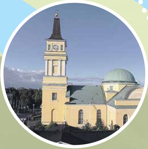
1. Oulun tuomiokirkko Kirkkokatu 3a, 90100 Oulu

Ouluun rakennettiin vuonna 1777 kivikirkko, josta aikanaan vuonna 1900 tuli Oulun tuomiokirkko. Tulipalossa vuonna 1822 kirkon puurakenteet paloivat, vain kiviseinät säilyivät ehjinä ja irtaimisto ehdittiin pelastaa. Kirkko rakennettiin uudelleen arkkitehti Carl Ludvig Engelin piirustusten mukaan. Runkona olivat alkuperäiset kiviseinät, uutta olivat keskuskupoli, kattorakenteet sekä torni. Kirkko valmistui 1832 ja torni 1845.