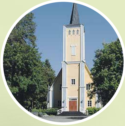
Muhoksen kirkko Kirkkotie 3, 91500 Muhos

Muhoksen nykyinen kirkko on valmistunut viimeistään vuonna 1634. Se on paikkakunnan kolmas kirkko, joka sijaitsee taajama-alueella Oulujoen rannalla. Perimätiedon mukaan ensimmäinen kirkko oli Kirkkosaaressa ja toinen Kirkkoniemellä nykyistä kirkkoa taempaan.