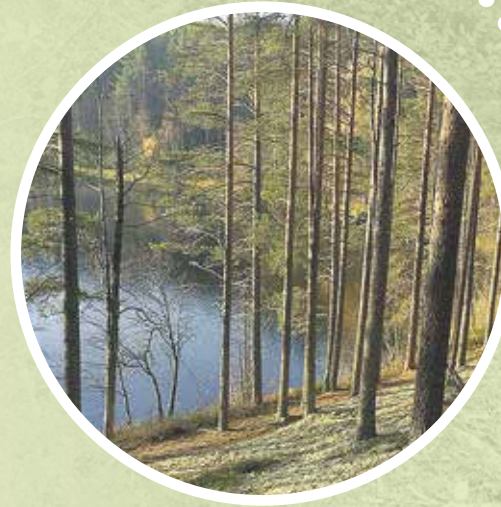
6. Rokuan kansallispuisto

Rokuan kansallispuisto sijaitsee Muhoksen, Utajärven ja Vaalan kuntien alueella. Puisto on perustettu vuonna 1956 suojelemaan Rokuanvaaran harjumuodostuman arvokkaita luontotyyppisiä ja maastonmuotoja.