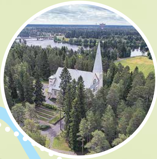
2. Oulujoen kirkko Oulujoentie 69, 90650 Oulu

Oulujoen kirkko sijaitsee metsäsaarekkeessa Oulujoen pohjoisrannalla Kirkkokankaan kaupunginosassa, noin viiden kilometrin päässä Oulun tuomiokirkosta.