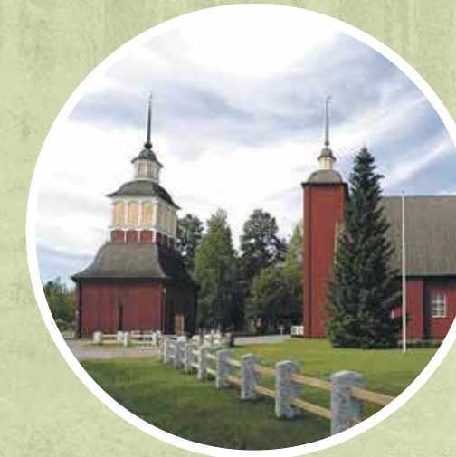
5. Utajärven kirkko Kirkkotie 5, 91600 Utajärvi

Tutustumista varten kirkon ajantasaiset aukioloajat kannattaa tarkistaa seurakunnan verkkosivuilta.