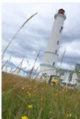
Marjanien majakka on otettu käyttöön vuonna 1872.