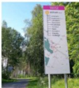
Oulussa on helppo pyöräillä, kun pääreitit on opastus on saatu karttoon.

Tarkoituksena on saada sovellukseen myös digitaalisesti muun muassa retkeilyreitit sekä käyntikohteet ja niiden tärkeä informaatio.