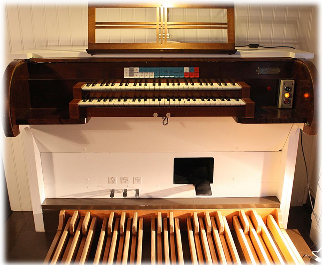
Ilmari Oikarainen (Opinnäytetyö: Säestyssoitinten vuosisata)