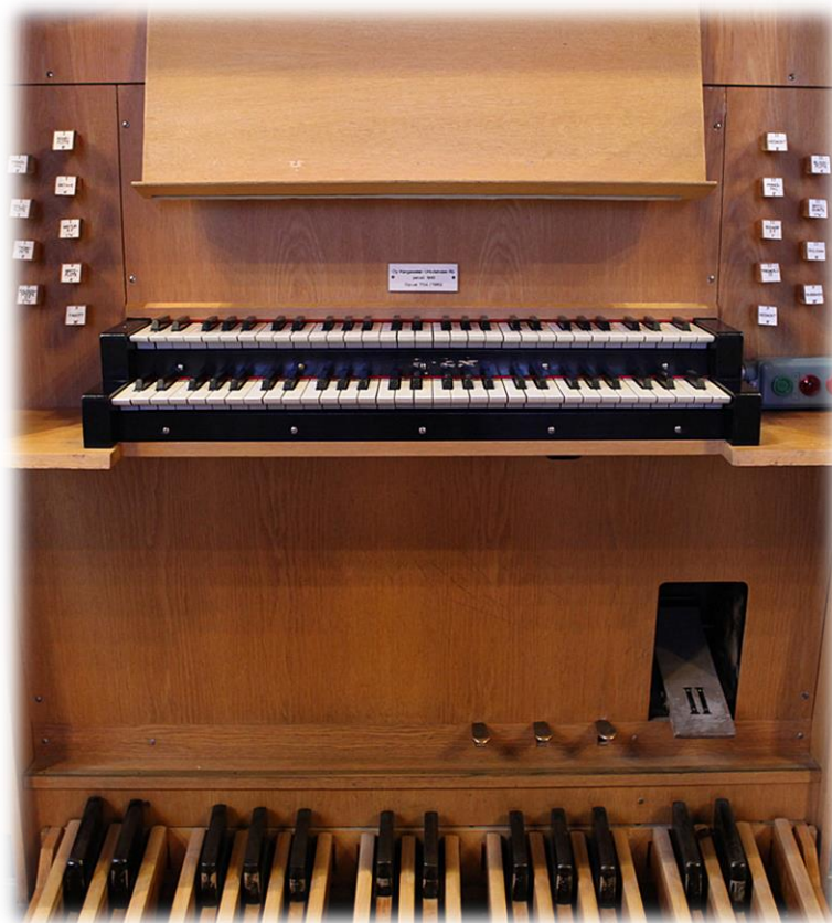
Ilmari Oikarainen (Opinnäytetyö: Säestyssoitinten vuosisata)