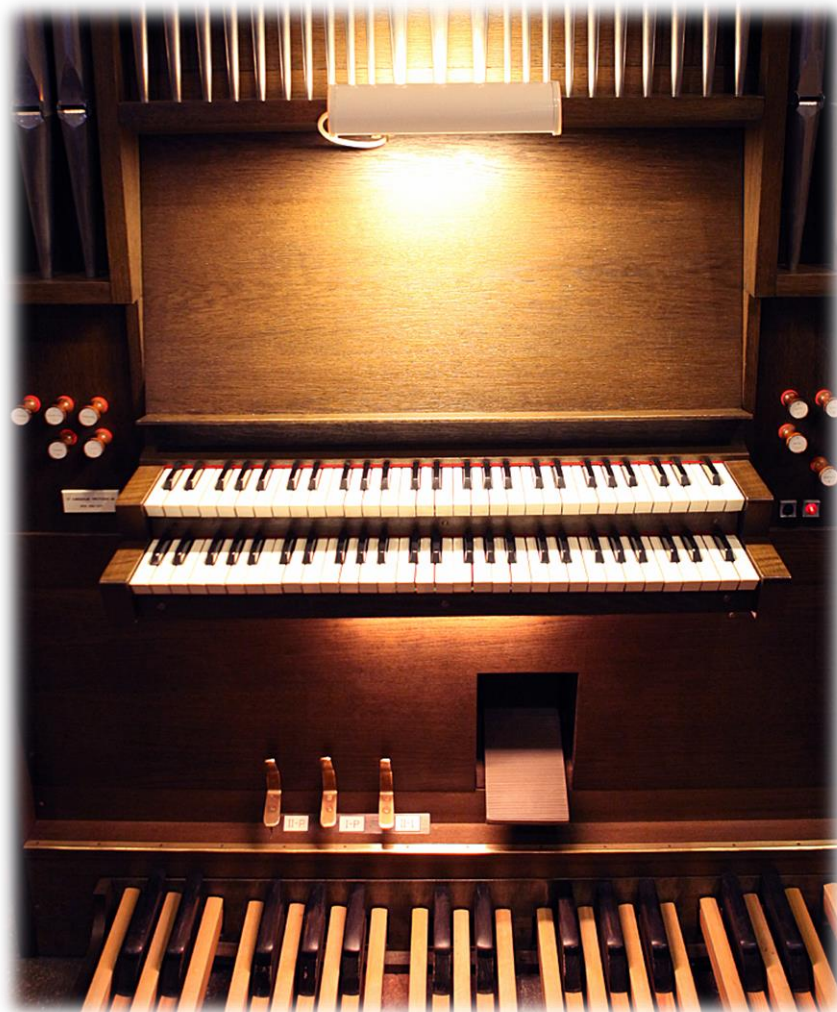
Ilmari Oikarainen (Opinnäytetyö: Säestyssoitinten vuosisata)