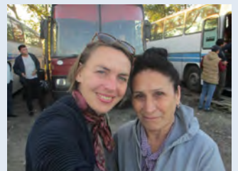
Muistetaan Guljaa Uzbekistanissa. Hän on siellä yksin uskonsa kanssa. Kuva viime kesältä lähtöhetkistä.

Naistenpäivässä oli kansainvälistä tunnelmaa. Naisia oli Kiinasta, Bulgariasta, Kazakstanista, Venäjältä ja Suomesta. Lisäksi päivässä oli vahva israelilainen lataus, kun päivään saapui myös nykyisin kirkossamme kokoontuvia messiaanisia juutalaisia. Heprealaiset tanssit toivat jalkoihin vipinää :)