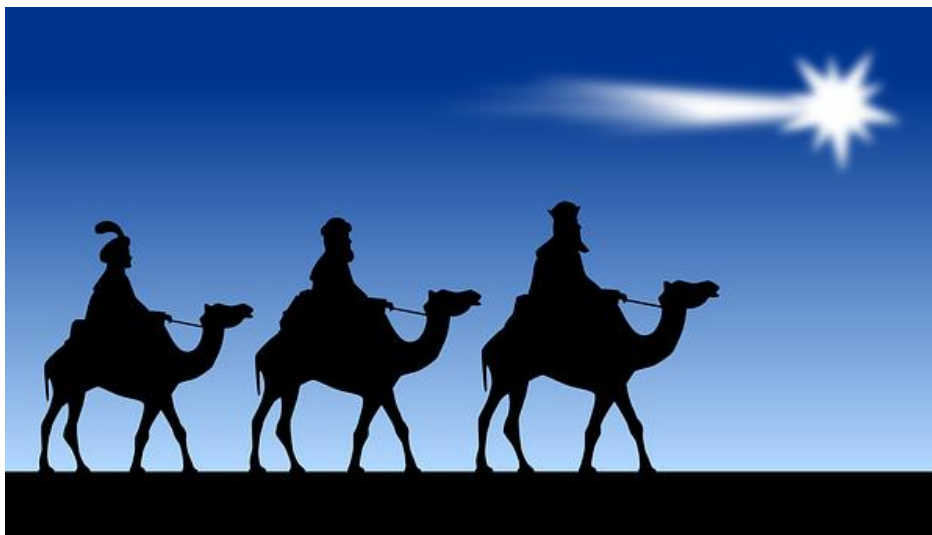
Kuva 2 Kolme itämaan tietäjää ratsastaa kameleilla, tähti johdattaa matkaa

Tähti se kulukeepi ∴ itäiseltä maalta ∴ ja se sanomaton kirkkaus se ulos loisti. Ja se tähti oli Jumalalta ∴ ulos lähetetty ∴ ∴ ja he riensivät uhraamaan kultaa, pyhää savua ja mirhamia ∴ ja mirhamia.