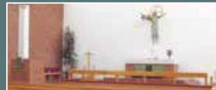
Karjasillan kirkko, Nokelantie 39