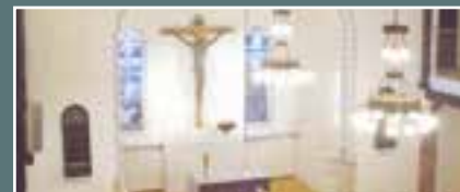
Tuiran kirkko, Myllytie 5