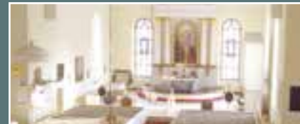
Oulun tuomiokirkko, Kirkkokatu 3 A