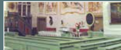
Kiimingin kirkko, Kirkkonniementie 6