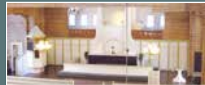
Oulujoen kirkko, Oulujoentie 69