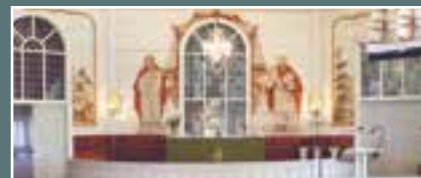
Haukiputaan kirkko, Kirkkotie 10