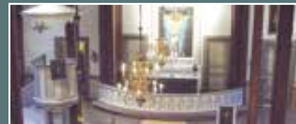
Oulunsalon kirkko, Uhririkkonkuja 2