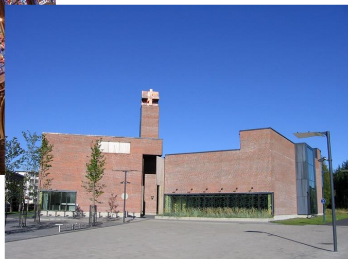
Kuva 6 Pyhän Andreaan tiilikirkko Oulu