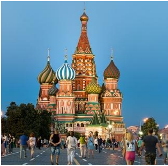
Kuva 2 Ortodoksinen suuri kirkko