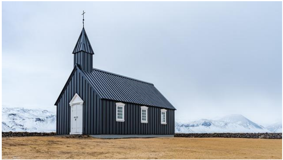
Kuva 1 Puukirkko Islannissa