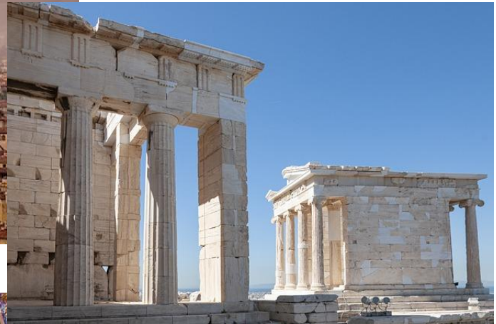
Kuva 4 Tempelin rauniot