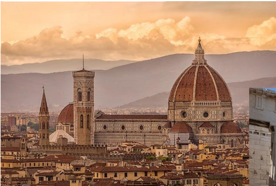
Kuva 3 Suuri katolinen kirkko keskellä kaupunkia etelässä