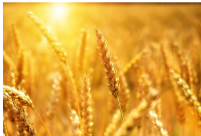
Kuva 22 vehnä