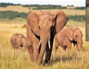
Kuva 10 elefanti