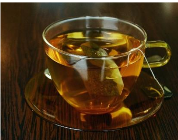
Kuva 19 tee