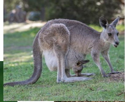
Kuva 11 kenguru

Tiikeri leijona ilves kenguru riikinkukko