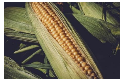
Kuva 21 maissi