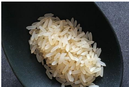
Kuva 17 riisi