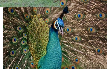
Kuva 15 Riikinkukko