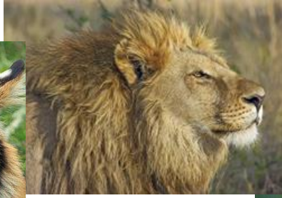
Kuva 13 leijona