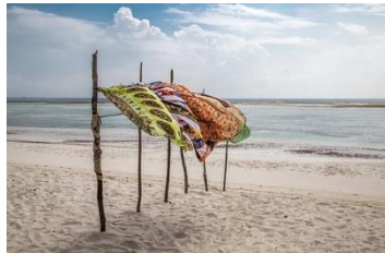
Kuva 5 ranta ja kangasaurionvarjo