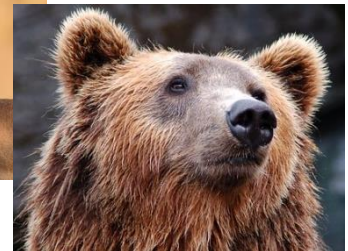
Kuva 9 karhu