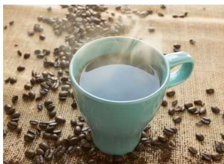
Kuva 18 kahvi