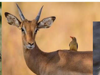
Kuva 6 antilooppi