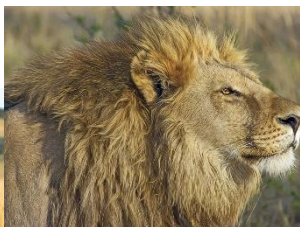
Kuva 7 leijona