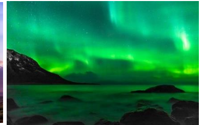
Kuva 3 revontulet