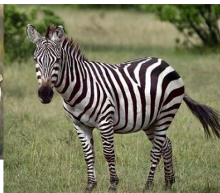
Kuva 8 seepra