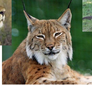
Kuva 12 ilves