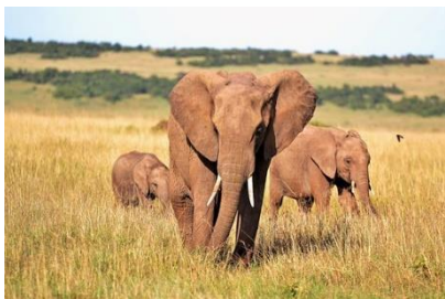
Kuva 2 elefanti