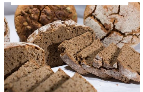
Kuva 20 ruis