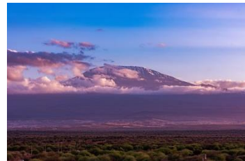
Kuva 4 vuoret