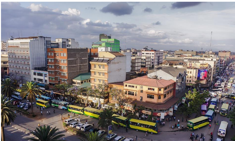
Kuva 3 Kenian pääkaupungin Nairobien elämää

Ja kaikkea muuta Keniassa viljellään, paitsi ruista.