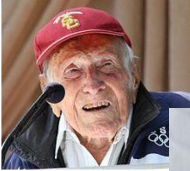
Kuva 3 vanhempi mies puhumassa lippalakissa

Yhdistä heille sopivat kengät. Kertovatko ne harrastuksesta, työstä vai muuten vapaa-ajasta.