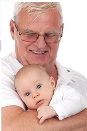
Kuva 9 Vanhempi mies vauva sylissä