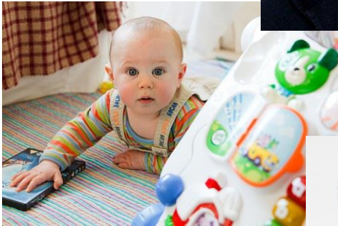
Kuva 12 Vauva leikkii lattialla