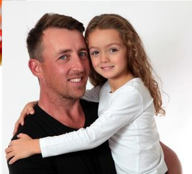
Kuva 11 Nuorempi mies tyttö sylissä