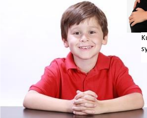
Kuva 10 Nuori poika hymyilee kasvokuvassa