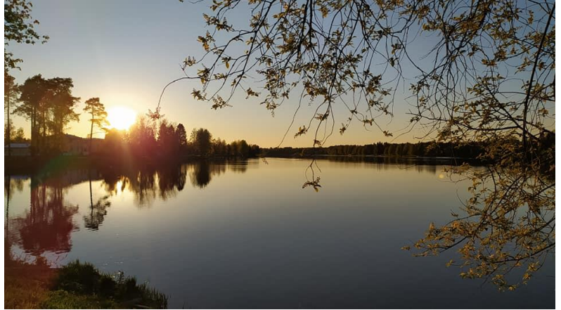
Kuva 1 Auringonlasku jokimaisemassa

Ympärillä on luonto vehreä, yllä sinitaivas kirkas ja lempeä Tuokoon kesä tämä iloa ja lepoa sekä voimaa ja onnen oloa.