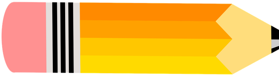
Kuva 1 puukynä, jossa terä katki

Tällä ensimmäisellä sivulla on ne mitä pitää korjata ja toisella sivulla ne millä voit korjata.