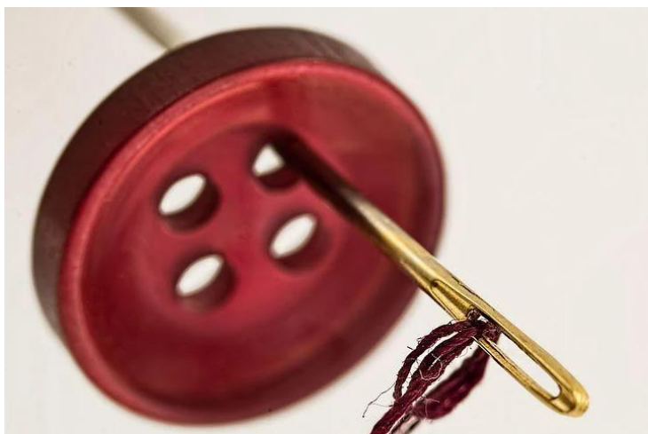
Kuva 6 nappi, neulaa ja lankaa