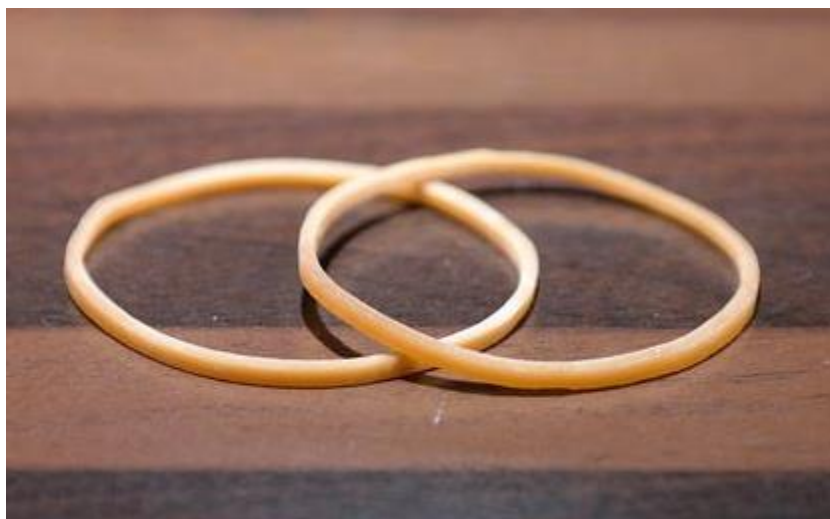
Kuva 7 kuminauhoja