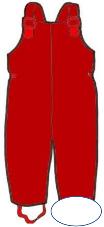
Kuva 3 kurahousut, joista toinen remmi katki