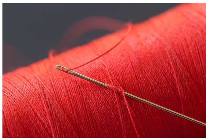
Kuva 8 neula ja lankaa