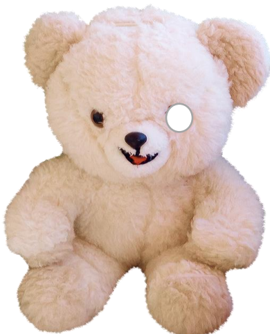
Kuva 5 Nalle, jolla silmä pudonnut