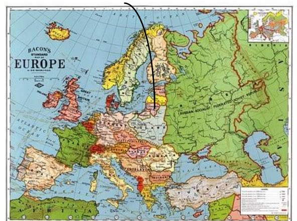
Kuva 4 repeytynyt kartta