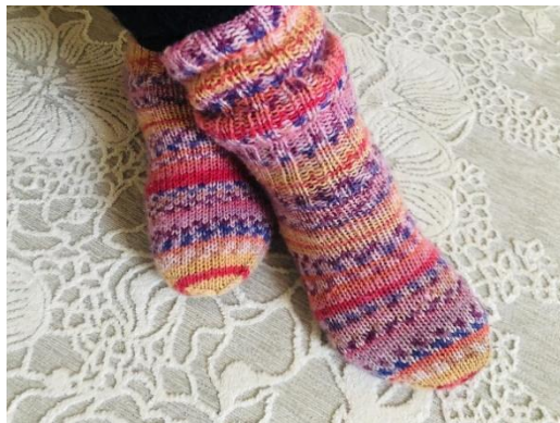
Kuva 2 villisukat