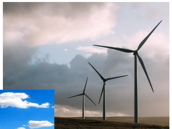
Kuva 1 tuulimyllyjä

(Kasvien siementen levitys, kulkeminen ja tuulienergia)