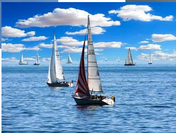
Kuva 3 Purjeveneitä merellä seilaamassa ja poutapilviä taivaalla