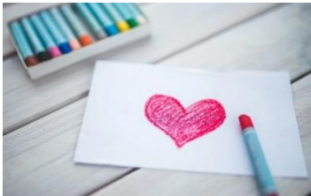
Kuva 2 piirretty sydänkortti ja kyniä