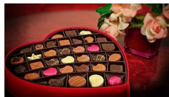
Kuva 4 sydänsuklaarasia