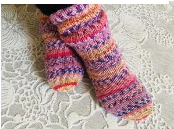
Kuva 6 jalat, joissa villasukat