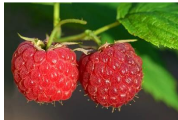
Kuva 1 vadelmat