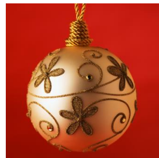
Kultainen joulupallo punaisella taustalla