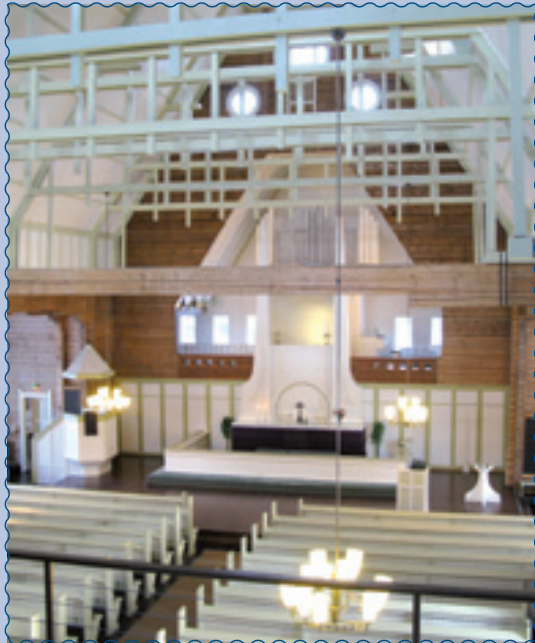
Oulujoen kirkko, Oulujoentie 69