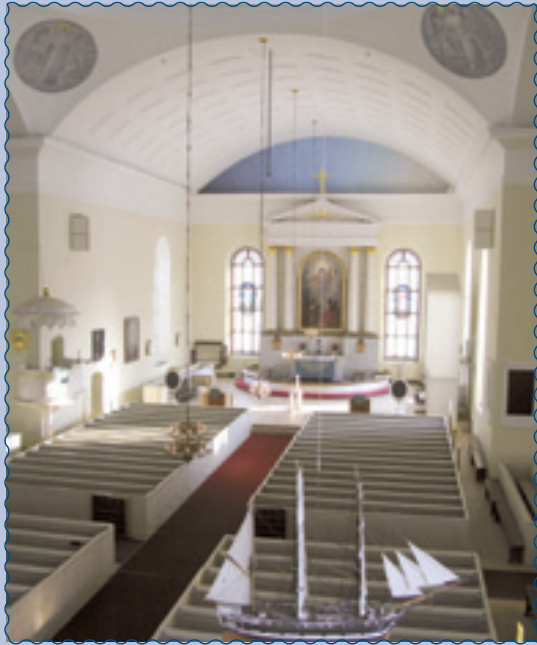
Oulun tuomiokirkko, Kirkkokatu