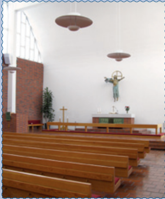
Karjasillan kirkko, Nokelantie 39