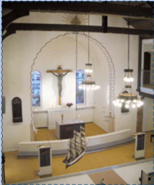
Tuiran kirkko, Myllytie 5